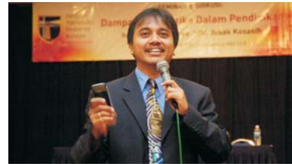
Seminar & Diskusi “Dampak Telematika Dalam Pendidikan” pada hari Rabu, 30 April 2008, sebagai key speaker menghadirkan Bapak Roy Suryo, seorang pakar telematika yang sangat populer di Indonesia.