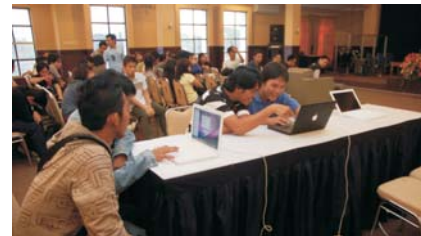
Apple Seminar & Workshop , bertempat di ITHB pada hari Jumat, 25 April 2008 bekerja sama dengan eStore - Authorized Dealer Produk Apple di Indonesia dalam rangka pengenalan produk Apple kepada mahasiswa.