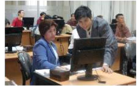
ICT Course For Parents, Sabtu 19 dan 26 Juli 2008 di Lab. CRC, It.4