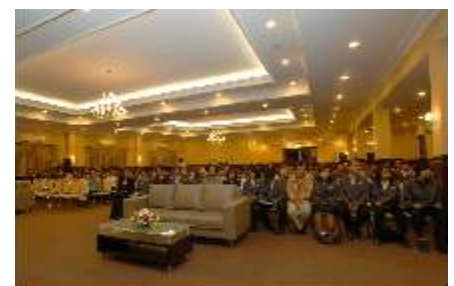
New Student Orientation Program 2008, Jumat-Sabtu 22-23 Agustus 2008, bertempat di kampus ITHB, diikuti oleh kurang lebih 370 orang mahasiswa baru ITHB. Serangkaian program orientasi penerimaan mahasiswa baru yang inovatif ini ditutup dengan Sidang Senat. Selamat mencoba, semoga Anda sukses dalam berkarir.