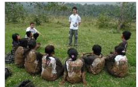
Outbound 2008, Rabu-Kamis 20-21 Agustus 2008, bertempat di Ranca Upas, Bandung. Program orientasi penerimaan mahasiswa baru yang dikemas dalam bentuk outbound training dengan nuansa kekeluargaan dan keakraban ini mempunyai tujuan diikuti oleh kurang lebih 370 orang mahasiswa baru ITHB