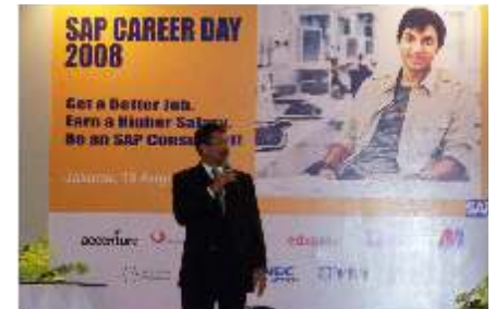
SAP Career Day 2008, Rabu 13 Agustus 2008 di Hotel Manhattan, Jakarta. Untuk event ini, ITHB memberi dukungan dengan menyediakan transportasi bus pariwisata yang mengantar 25 orang mahasiswa ITHB pulang-pergi. Beberapa dari peserta SAP Career Day yang telah submit CV sebelum acara mendapat kesempatan interview langsung dengan perusahaan, antara lain IBM, METRODATA, Anabatics dan Astragraphia.